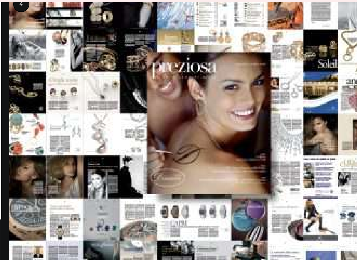
Preziosa Magazine, n.1/2008